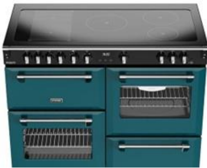
Steuerung Kochfeld über Bedienknebel