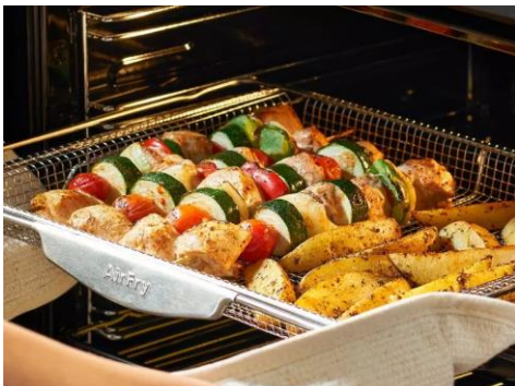
NEU - jetzt mit AIR FRY Funktion