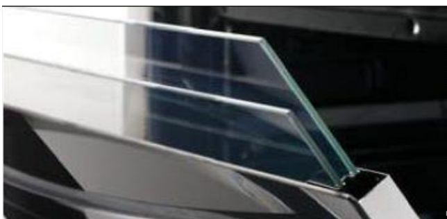
3-fach verglaste Backofentür