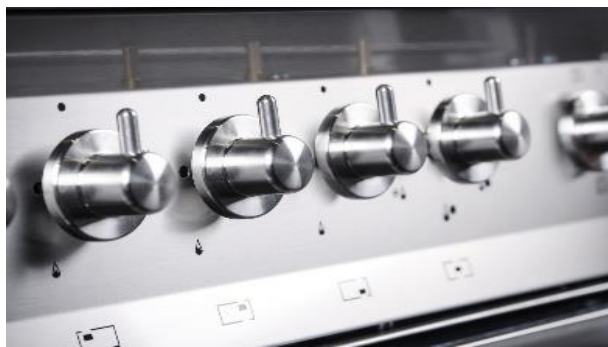
Metall - Bedienknöpfe