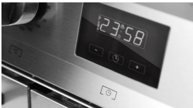
TOUCH CONTROL TIMER