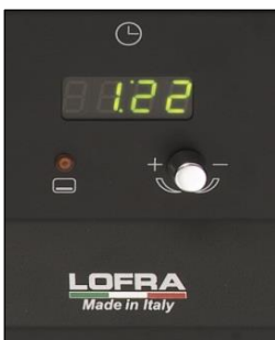
Digitale Uhr mit Timerfunktion