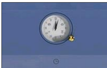
Analoge Uhr mit Timer