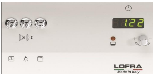
Digitale Uhr mit Timerfunktion