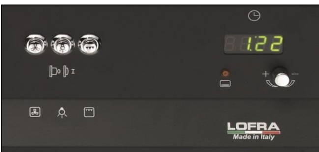
Digitale Uhr mit Timerfunktion