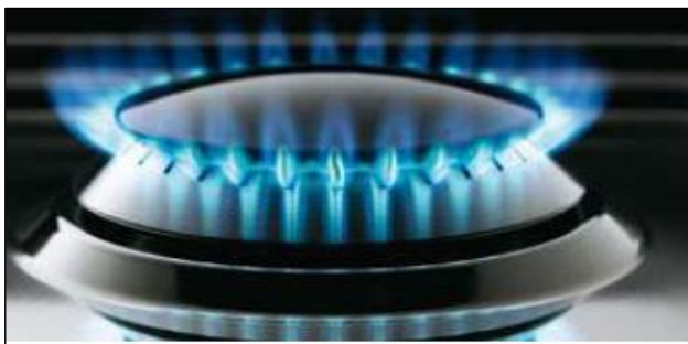
Besonders energieeffiziente SERIE III Gasbrenner

Eingestellt auf Erdgas (20 mbar) Flüssiggasdüsen 50 mbar beiliegend