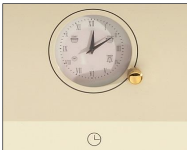
Analoge Uhr mit Timer