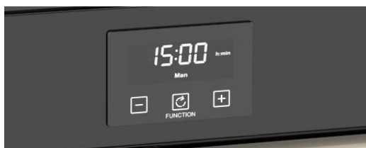
(Maxi-Clock™ LED Touch Control Timer)