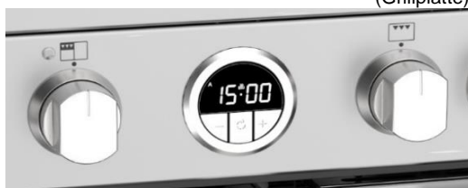
(Maxi-Clock™ LED Touch Control Timer)