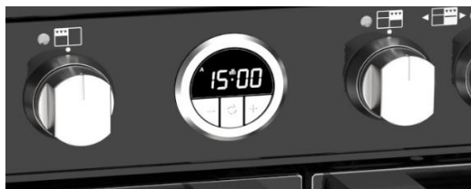
(Maxi-Clock™ LED Touch Control Timer)