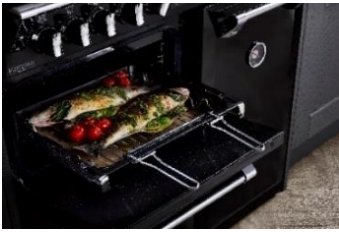
(Backblech mit Einlegerost und Griff)