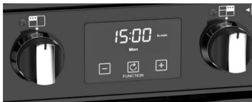
(Maxi-Clock™ LED Touch Control Timer)