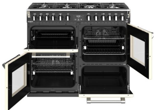
(Maxi-Clock™ LED Touch Control Timer)