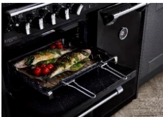
(Backblech mit Einlegerost und Griff)