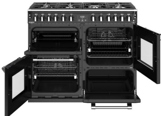
(Maxi-Clock™ LED Touch Control Timer)