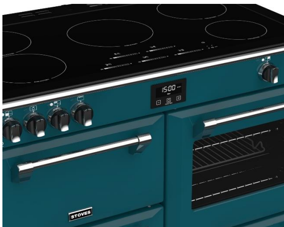
(Maxi-Clock™ LED Touch Control Timer)