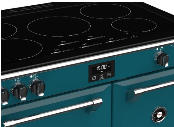
(Maxi-Clock™ LED Touch Control Timer)