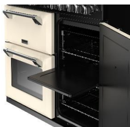
(PRO FLEX™ Unterteilung)