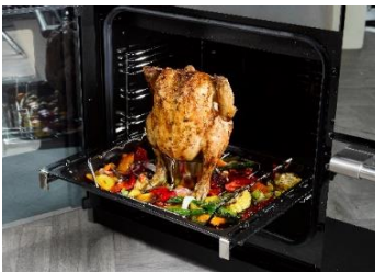
(Hähnchengriller mit Aromatopf)