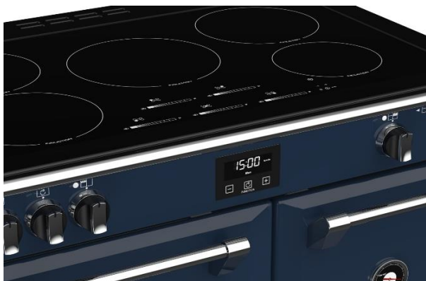
(Maxi-Clock™ LED Touch Control Timer)