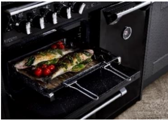
(Backblech mit Einlegerost und Griff)