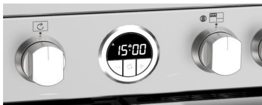
(Maxi-Clock™ LED Touch Control Timer)