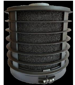
Longlife Aktivkohlefilter 2 Jahre haltbar