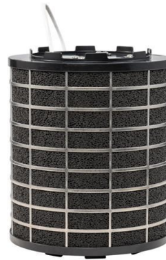
Plasmafilter 10 Jahre Wartungsfrei