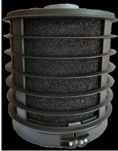
Longlife Aktiv Kohlefilter